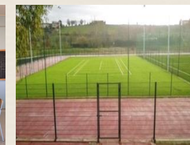
Campo sportivo polifunzionale